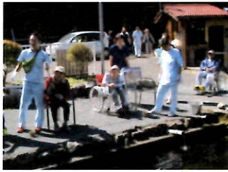
10月9日「マス釣り」 釣った魚をその場で焼いて、美味しく頂きました。