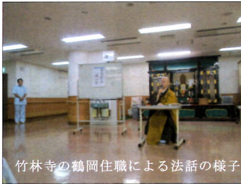
竹林寺の鶴岡住職による法話の様子