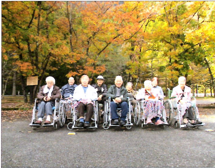
11月13日「紅葉ハイク」 奥多摩湖へ行ってきました!