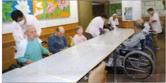
『指圧奉仕会の皆様』

笑顔で言葉かけをしながら優しく指圧して下さい利用者皆様も毎回楽しみにしています。