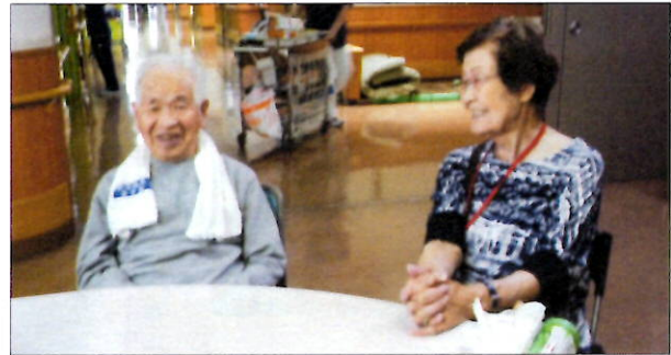
『傾聴ボランティアふくろうの皆様』