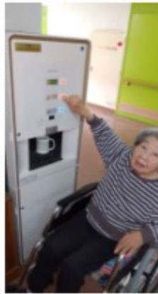
寄贈 杉並ボーイスカウト第8団

30年以上寿楽荘に施設訪問に来て頂いておりましたボーイスカウト杉並第8団様が令和5年3月をもっての閉団にあたり、ご縁のあった寿楽荘ご利用者の為にと給茶機(ティーサーバー)のご寄付を頂戴しました。この場を借りて厚く御礼を申し上げます。